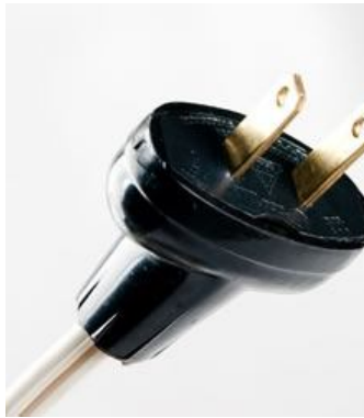
Clavija Sin tierra Física