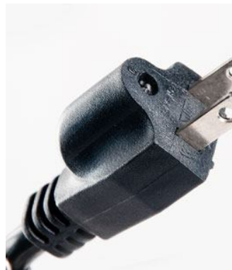
Clavija Con tercer cable cortado irresponsablemente