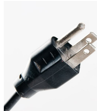
Clavija con tierra física, correctamente aterrizada